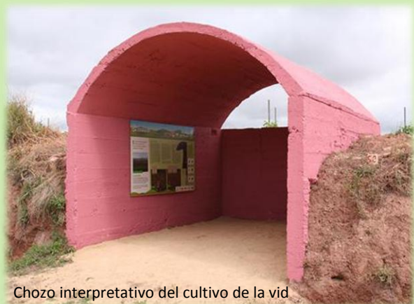
Chozo interpretativo del cultivo de la vid