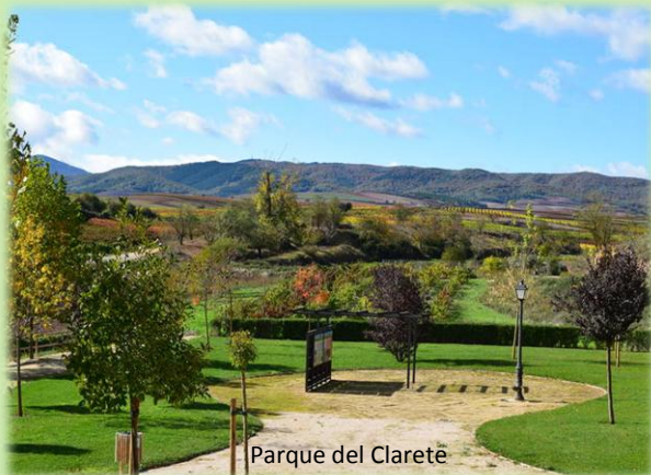
Parque del Clarete