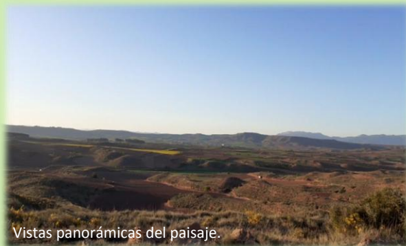
Vistas panorámicas del paisaje.