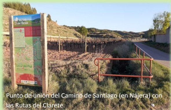
Punto de unión del Camino de Santiago (en Nájera) con las Rutas del Clarete.