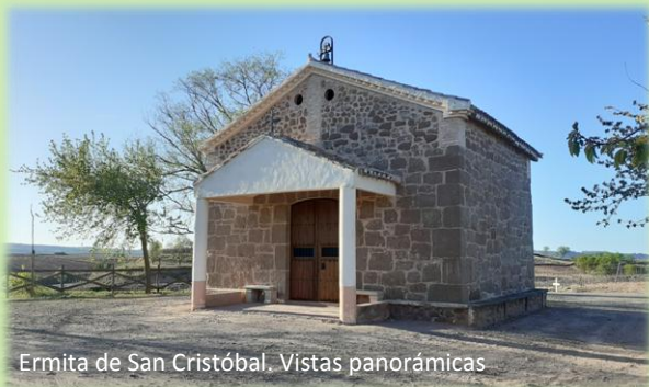
Ermita de San Cristóbal. Vistas panorámicas