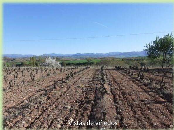
Vistas de viñedos